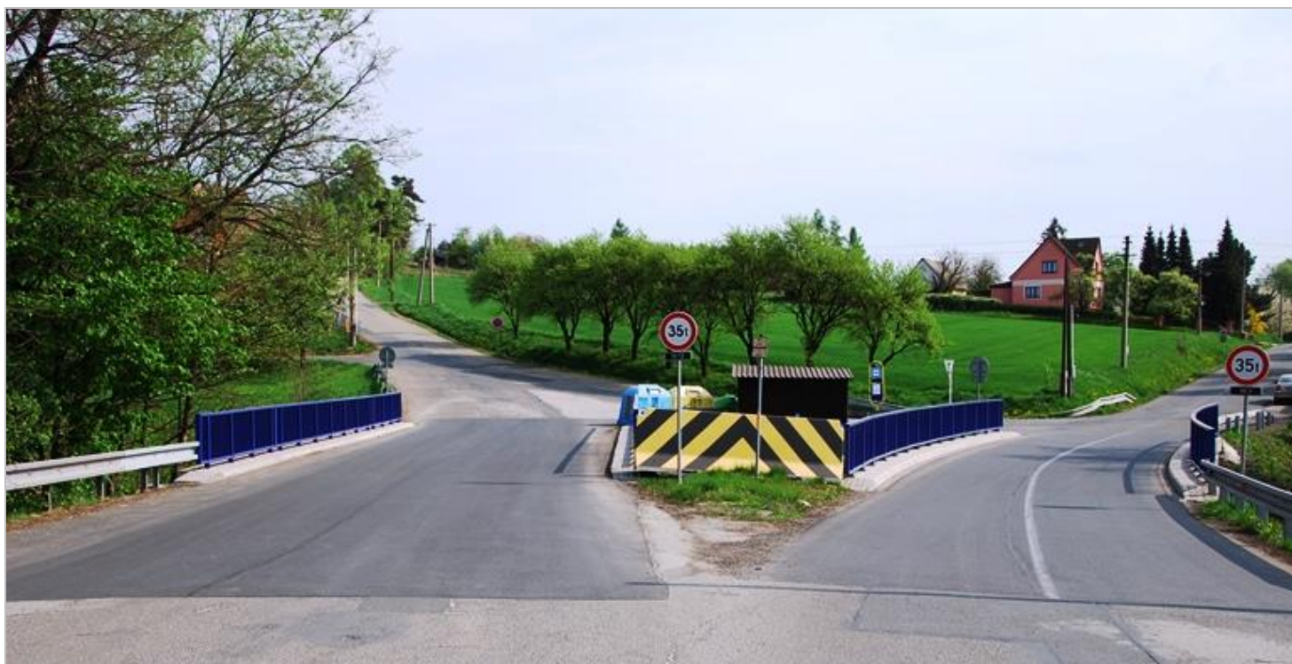
Most přes potok Staviska - Třinec