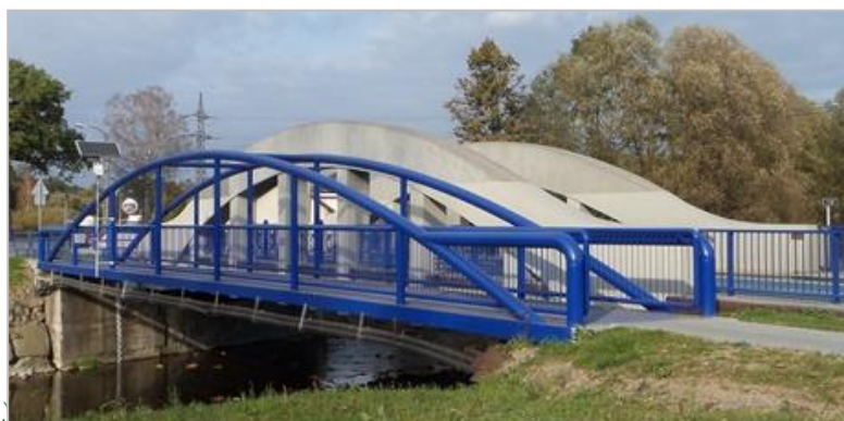
Přechodová lávka Ropice

Strojírny a stavby Třinec, a.s. Průmyslová 1038, Staré Město 739 61 Třinec Česká republika